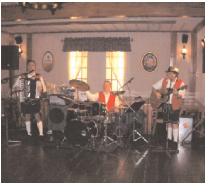
L'orchestre bavarois qui a animé la soirée dansante du 28 octobre dernier, au restaurant Fourquet-Fourchette.