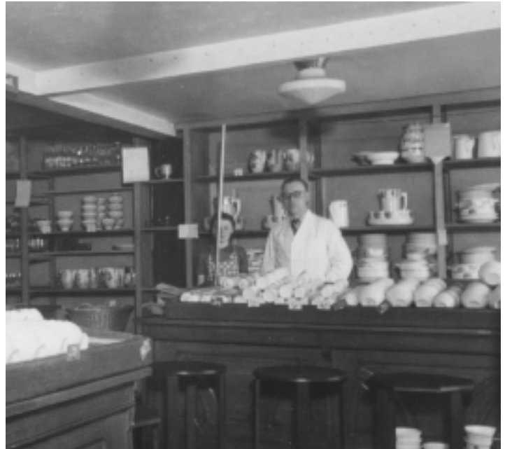
mon père, dans son magasin